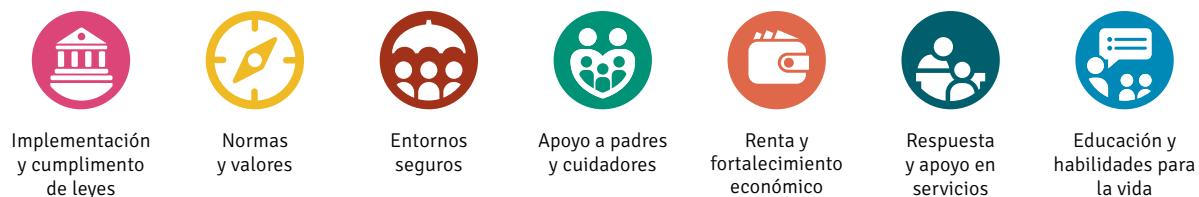
Figura 3 INSPIRE – Siete estrategias para poner fin a la violencia

Fuente: Alianza Global para Poner Fin a la Violencia contra la Niñez